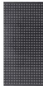
PH6 模组 (Module)

The indoor full color series include PH4, PH5, PH6, PH7.62, PH8, PH10.