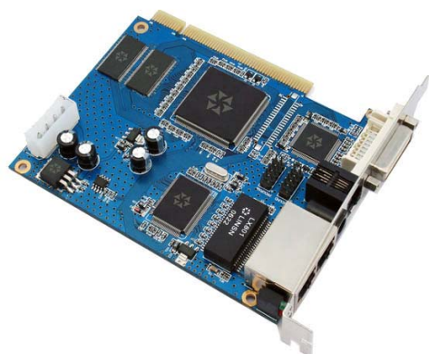
控制卡 (Control card)