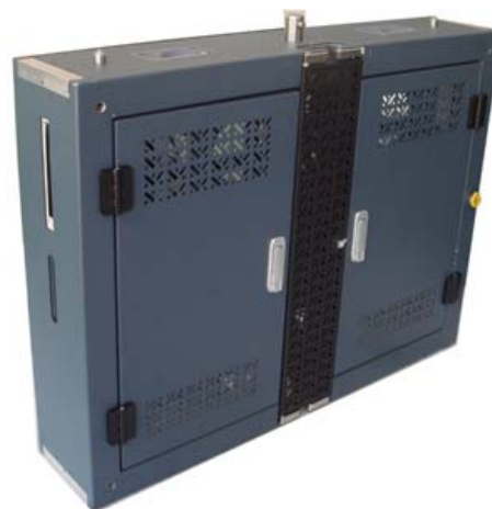
Ph6 吊装箱体 (Cabinet)